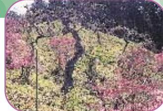
■シダレ栗自生地 普通の栗の木が突然変異したもので、枝がこんもりと地表に垂れ下がった珍しい栗の木です。約6000m 2 の土地に80本程度自生しています。(国指定文化財)