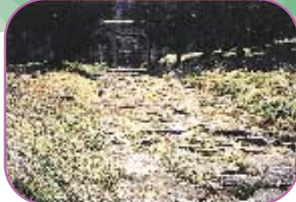
■初矢峠の石畳 全長約2.6kmあり、飛騨と美濃を結ぶ東山道。石畳は、コースの中に幅2km、全長80.4mの区間のみ現存し、文化財として保存されています。(県指定文化財)