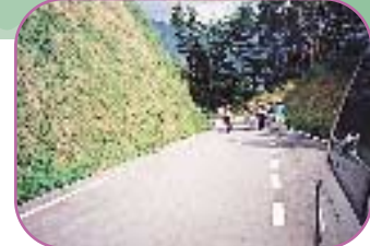
■広域基幹林道 下呂町と萩原町を結ぶ林道です。松、杉林の針葉樹が主となっていますが、木立の間から見える景色は、心地よい安らぎの空間を与えてくれます。